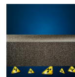
Chrání proti radonu