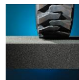
Vysoce pevná v tlaku